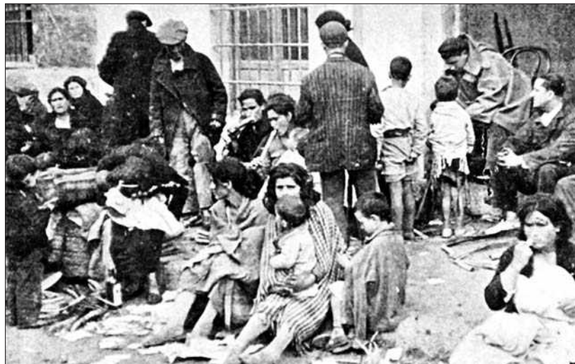
A dalt. "Camino hacia almería", i a baix, "La caña de azúcar como escaso y único alimento". Tret del llibre de Norman Bethune: "El crimen de la carretera Málaga-Almería" (febrero de 1937) (Consejería de Cultura. Centro Andaluz de la Fotografía, Diputación Provincial de Málaga, 2004, pàg. 153 i 155).