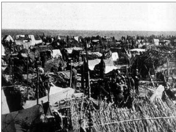
Vista d'un camp de concentració francès.

cosa que vaig creure que serien trossets de carn i no!, no era carn, eren trossos de puro d'aquells senegalesos, que havien escopit en aquella gasòfia que ens van dur.