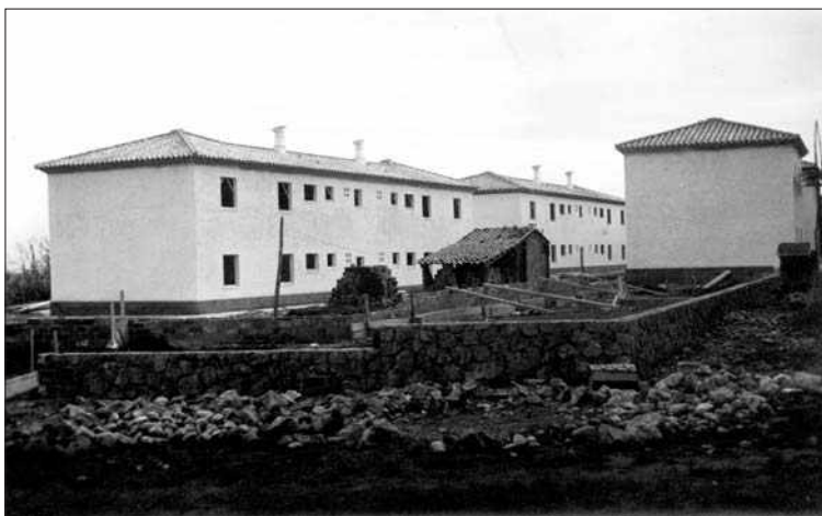
Grup d'habitatges de can Gimferrer quan s'edificava. Any 1949-1950.