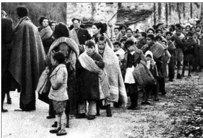
Criatures al pas fronterer amb França.

dies d'abril de 1939, vam emprendre la fugida cap a França. Ens vam ajuntar amb altres persones, que venien per passar els Pirineus, sense saber el camí, per aquelles muntanyes, per alguns llocs inaccessibles, destrossats. Vam haver de passar el riu de Pont de Molins a peu, per dins de l'aigua. Vam arribar a la carretera i per fi a la frontera, nevava molt aquell dia i vam haver d'estar asseguts a terra, sota una alzina, plens de neu i tremolant de fred. Les meves germanes, que eren petites (la petita tenia vuit mesos), van agafar una pulmonia quan ens van deixar entrar a França. Vam ser conduïts al Pertús per uns negres senegalesos. Ens moríem de por, jo m'amagava amb la meva mare per a no veure'ls.