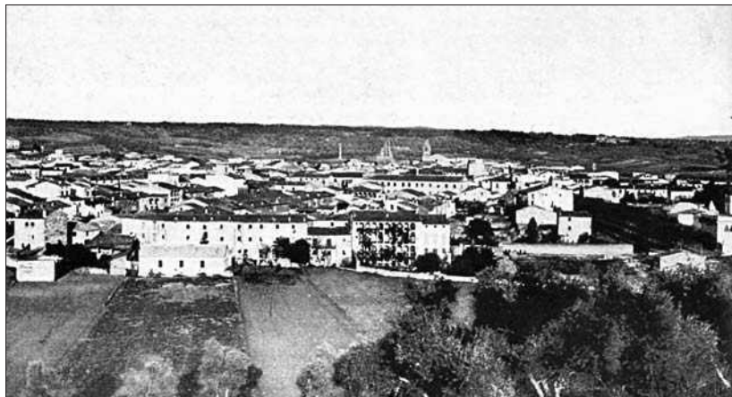
Banyoles a la dècada dels cinquanta. Fons d'imatges de l'Ajuntament de Banyoles.