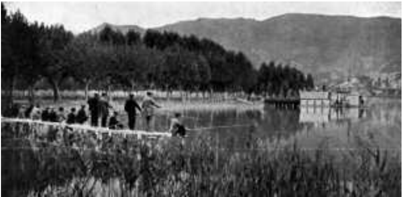
Festa del Peix de l'octubre de 1910.