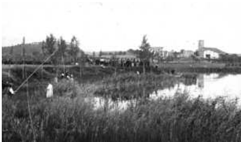
Concurs de pesca als anys deu. Fotògraf: Manuel Pigem i Ras. Recull documental de Lluís Martí i Salló.