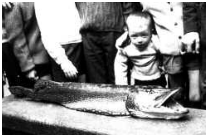
Un lluç de riu de mida més que considerable. 1961.