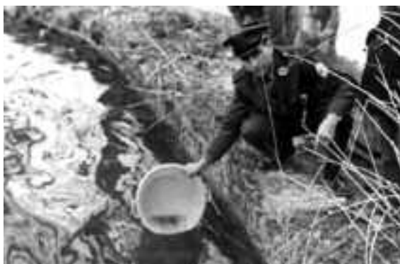
Una altra imatge de la repoblació de black-bass. Fotos Lis. Recull documental de Salvador Duran i Coderch