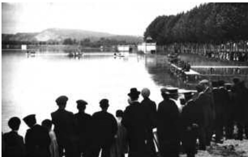
Un moment de la pesca, amb les pesqueres al fons, durant la Festa del Peix. Octubre de 1910.