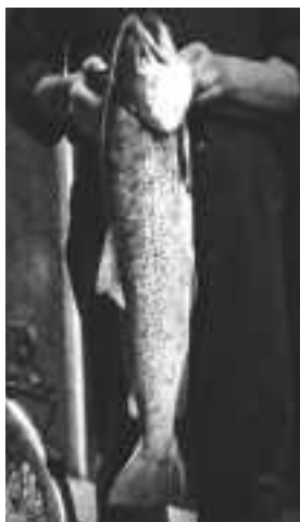
Un magnífic exemplar femella de truita de 78 centímetres i 4 quilograms. Recull documental de Salvador Duran i Coderch.