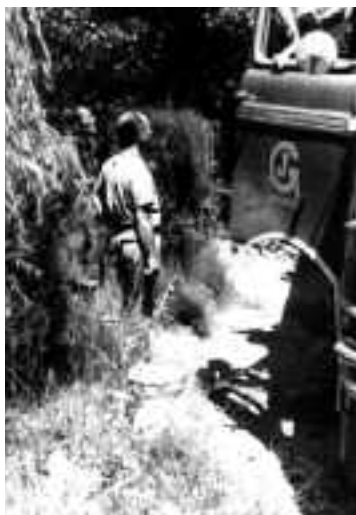
Anada a la piscifactoria d'Osca. El camió de transport. Recull documental de Salvador Duran i Coderch.