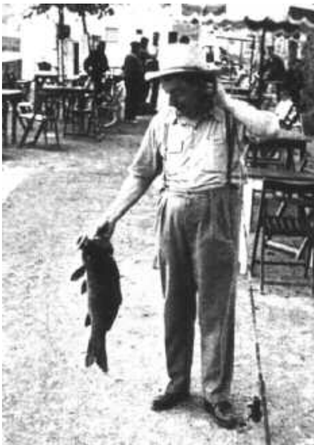
Un pescador feliç amb la seva carpa. Anys cinquanta.