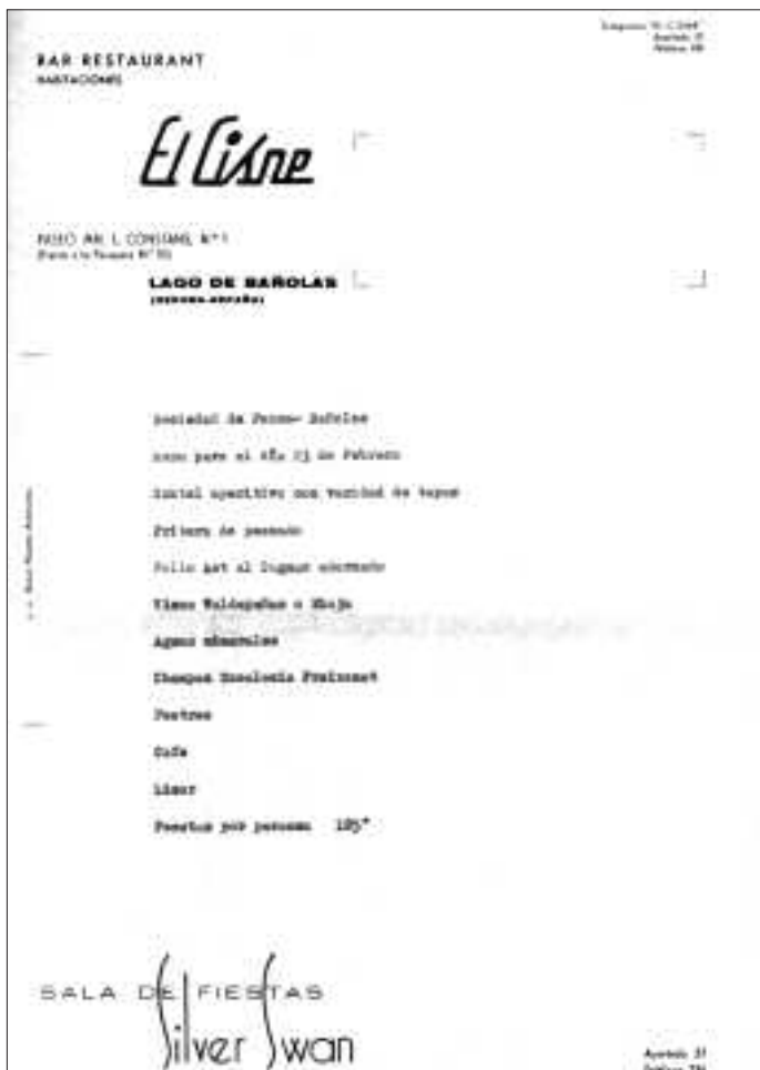
Un menú a El Cisne. Recull documental de Salvador Duran i Coderch.