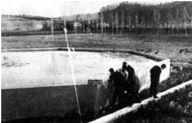
Els viviers Dubish. Recull documental de Salvador Duran i Coderch.