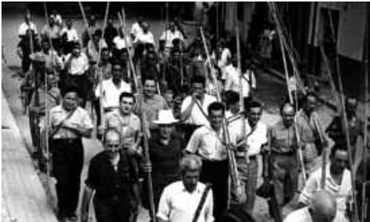
Marxant cap a l'estanyol. Anys cinquanta. Fotògraf: Cruells. Recull documental de Salvador Duran i Coderch.