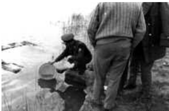
Detall de la repoblació de black-bass. Fotos Lis. Recull documental de Salvador Duran i Coderch.