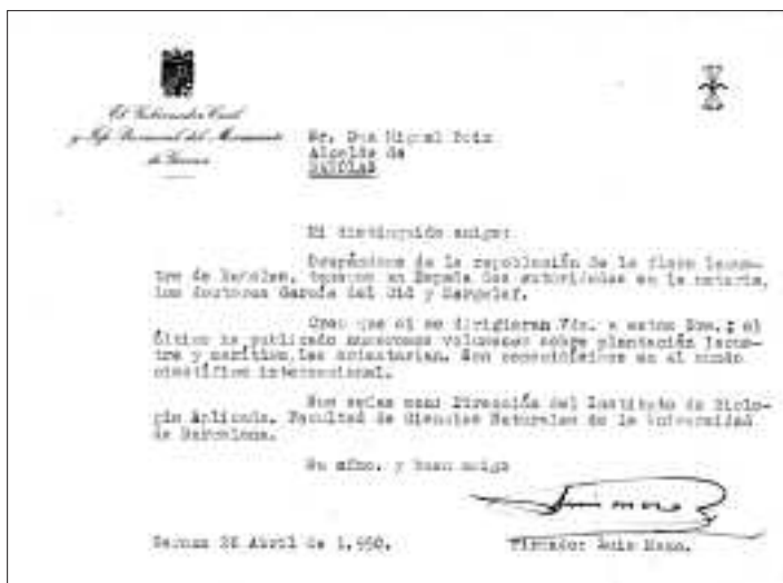
Carta del governador civil adreçada a l'alcalde Miquel Boix. 1950.