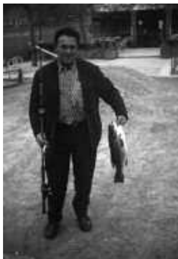
Exemplar de black-bass. Anys seixanta. Recull documental de Salvador Duran i Coderch.