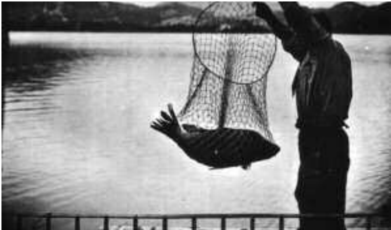
S'ha pescat una carpa. Fotògraf: L.Roisin. Recull documental de Lluís Martí i Salló.

Actualment a més hi queden encara gambusies. Aquest peix no tinc coneixement d'on ens va venir. (Tal vegada de Pals o d'alguna piscifactoria enmig d'altres alevins). Sí que podem donar gràcies de la seva existència a les nostres aigües, pel fet que és una de les millors armes en la lluita antipalúdica, ja que la seva alimentació principal són les larves dels mosquits. És un peix minúscul de color entre verdós i groguenc, semitransparent, que abunda a les embocadures dels recs i als aiguaprims.