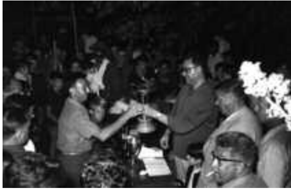
Concurs de pesca de la Festa d'Agost. Recull documental de Salvador Duran i Coderch.