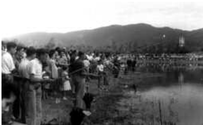
Concurs de pesca. 1952. Recull documental de Lluís Martí i Salló.