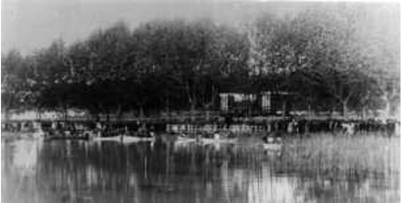
La Festa del Peix. Octubre de 1910.