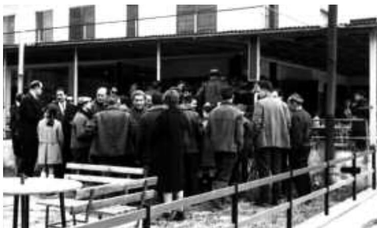
Participants en el concurs de pesca del lluç de riu. Recull documental de Salvador Duran i Coderch.