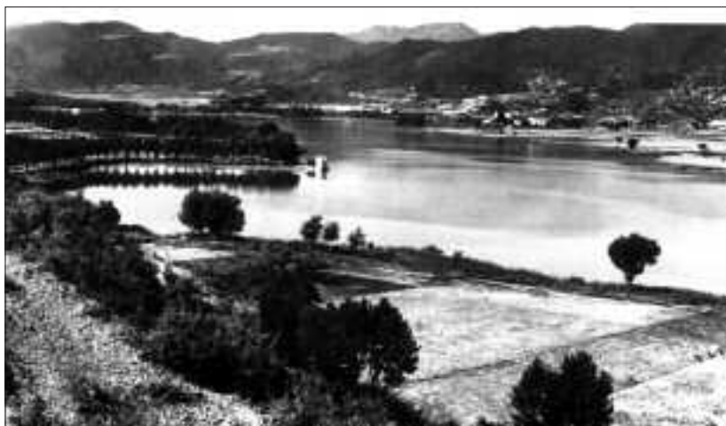
Vista de l'estany de Banyoles.