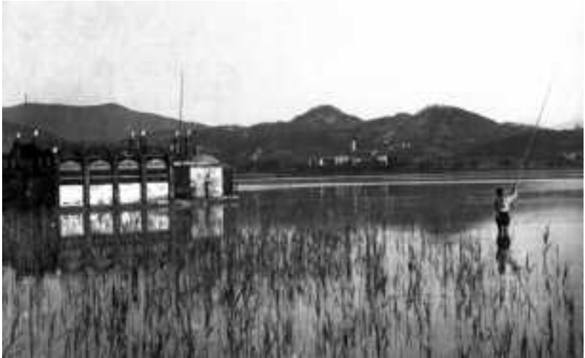
De pesca a l'estany de Banyoles.