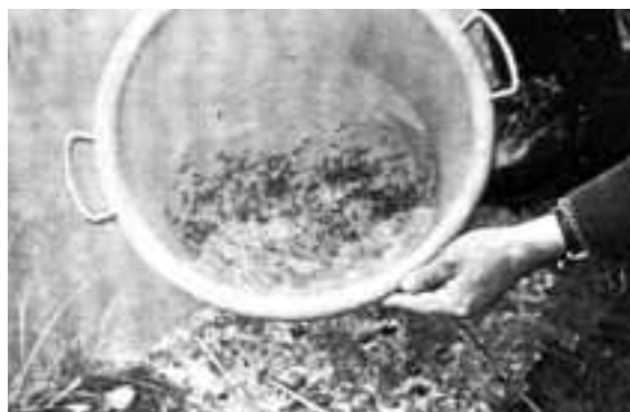
Repoblació de black bass. Detall dels alevins de black-bass.