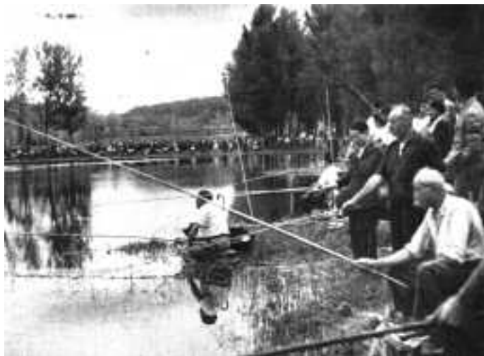
Concurs de pesca. Semana , 1 de setembre de 1953.