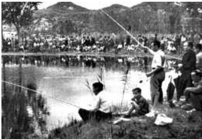
Concurs de pesca. Detall de l'estanyol amb els vims segats. Semana , 1 de setembre de 1953.