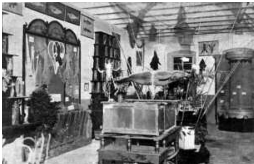
Exposició de piscicultura durant la Festa del Peix. Octubre de 1910.