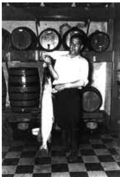
En Daranas amb un lluç de riu. 1960.