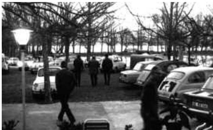
Detall de l'aparcament dels cotxes dels concursants, al fons s'hi veu l'estanyol.