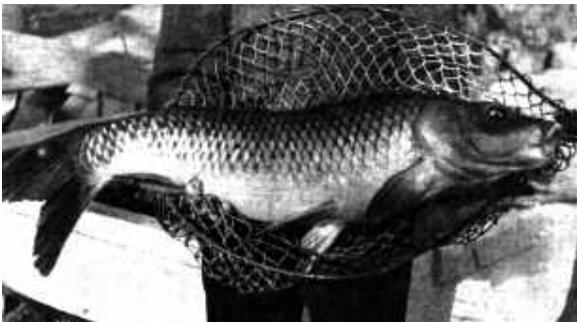
Detall de la carpa enviada a Barcelona. 1936.