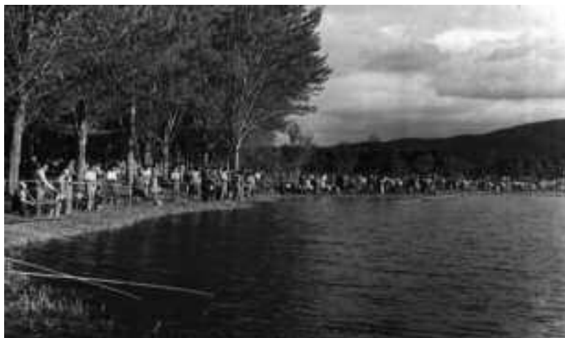
Concurs de pesca de 1970.