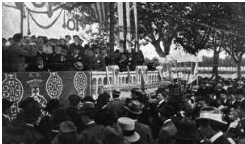
Tribuna d'autoritats de la Festa del Peix. Octubre de 1910.