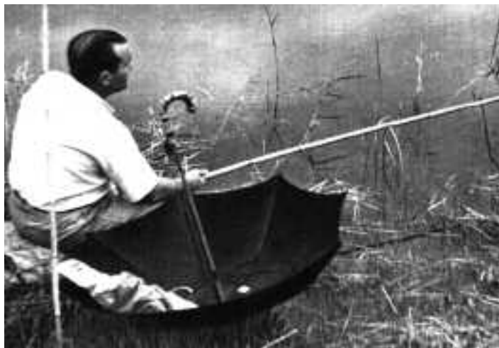
Concurs de pesca. Detall on es pot veure la tallada vims canyissars. Fotògraf: J. Cadena. Semana , 1 de setembre de 1953. Col·lecció de Salvador Boix.