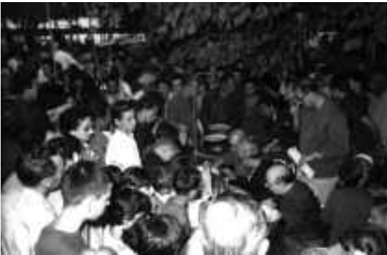
Concurs de pesca de la Festa d'Agost. Recull documental de Salvador Duran i Coderch.