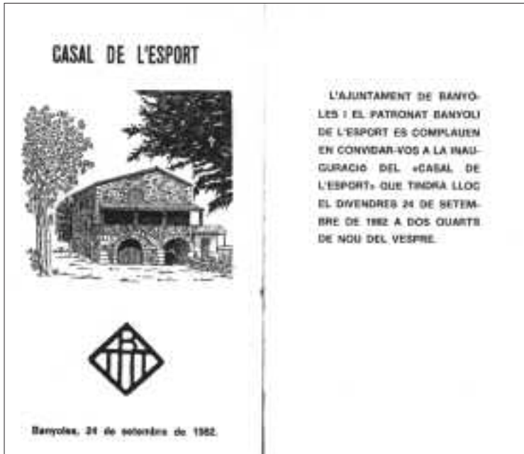
Recordatori de la Inauguració del Casal de l'Esport. Recull documental de Salvador Duran i Coderch.