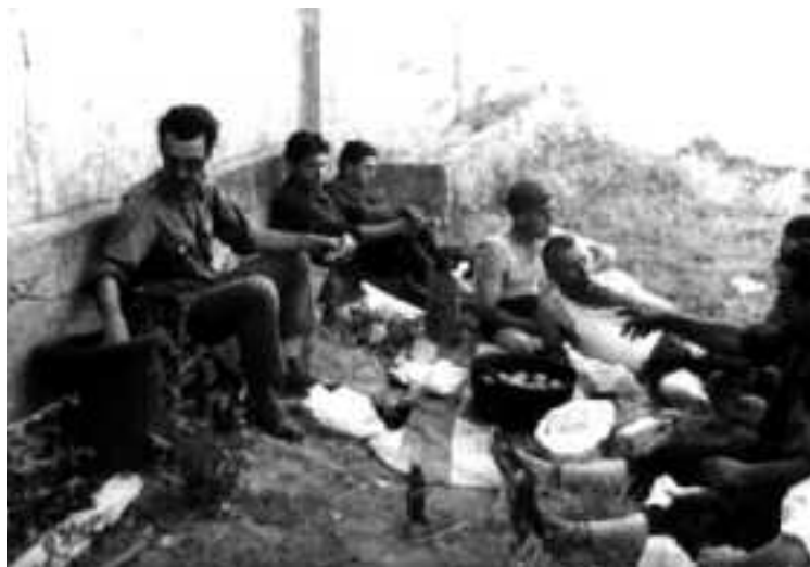
Anada a la piscifactoria d'Osca. Sopar a la fresca. Recull documental de Salvador Duran i Coderch.