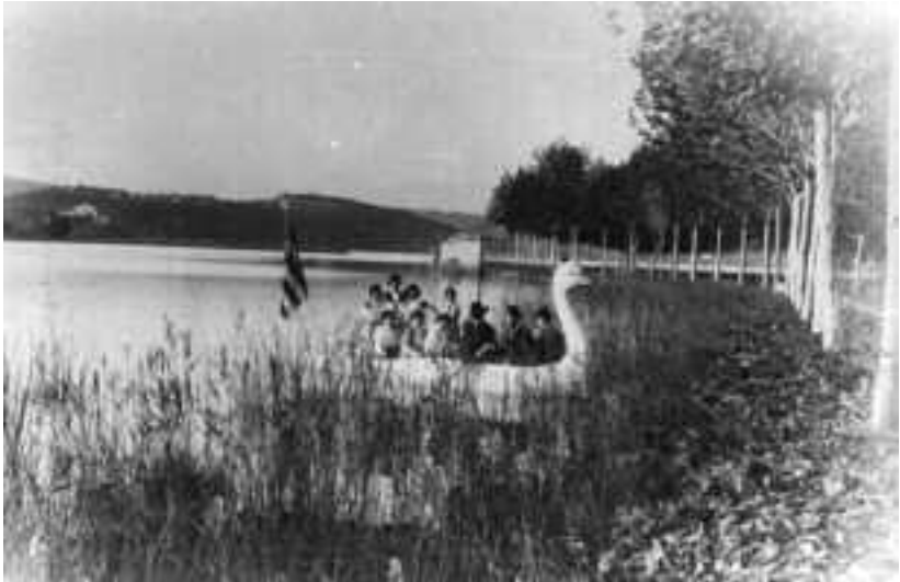
La barca de l'Oca als anys deu del segle XX. Recull documental de Salvador Duran i Coderch.