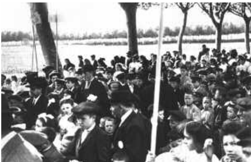
Visió dels públic assistent a la Festa del Peix. Octubre de 1910.